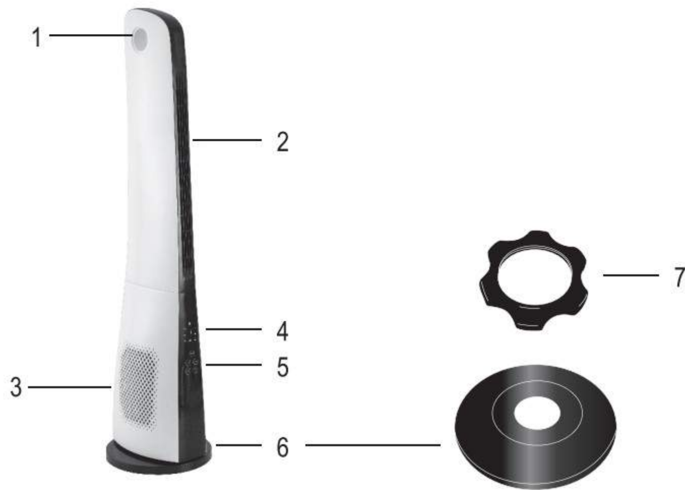
Figure 2. / 2. ábra / 2. obrázok / fig. 2 / 2. skica / 2. skica / 2. obrázek / 2. skica / rysunek nr 2