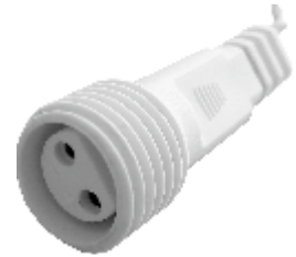
fig. 2. / Abbildung 2 / 2. ábra / obraz 2. / Figura 2. / 2. skica / 2. skica / obraz 2.