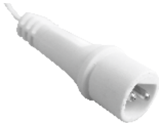
fig. 1. / Abbildung 1 / 1. ábra / obraz 1. / Figura 1. / 1. skica / 1. skica / obraz 1.