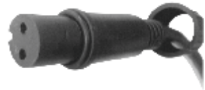
fig. 2. / Abbildung 2 / 2. ábra / obraz 2. / Figura 2. / 2. skica / 2. skica / obraz 2.