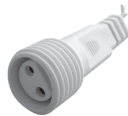
fig. 2. / 2. ábra / obraz 2. / Figura 2. / 2. skica / obraz 2.