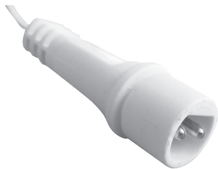
fig. 1. / 1. ábra / obraz 1. / Figura 1. / 1. skica / obraz 1.